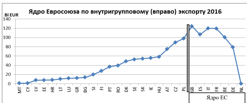
Рис. 2. Ядро Евросоюза по внутригрупповому экспорту 2016

Напомним также, что в предлагаемом подходе очень важен порядок элементов. Более того, важнейшую информацию несет сама определяющая последовательность всех элементов и сопровождающая ее последовательность значений весовой функции \pi(i, H) , характеризующей сумму внутригруппового экспорта каждой страны i в страны, расположенные в этой последовательности справа от нее 1 (см. рис. 2):