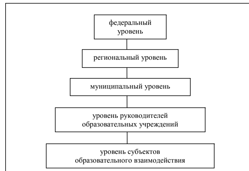
Рис. 2. Уровни системы образования

Одинаковых критериев эффективности управления качеством образования на всех уровнях в принципе быть не может, поскольку в основе работы людей на каждом уровне лежит разная предметная деятельность: педагогическая – у учителей, воспитателей; управленческая – у работников других уровней. Поэтому разработаны соответствующие подходы к управлению качеством образования на каждом уровне, которые воздействуют на разные объекты и имеют разные критерии своей эффективности.